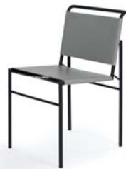
Leder grau leather grey