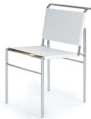
Leder weiß leather white