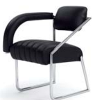
NON CONFORMIST 1926