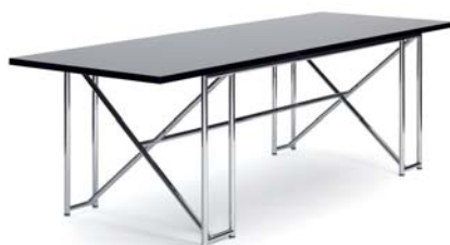
DOUBLE X 1928