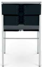
Leder schwarz leather black

Estructura de tubos de acero cromado o pulverizado. Asiento y respaldo de cuero ceñido. Detalles y colores ver lista de precios.