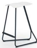
Counter kitchen height